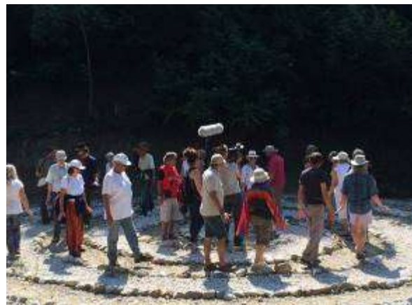
Reinigungsritual im Doppel-Labyrinth im Park “Ravne 2”