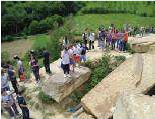
Künstlicher kegelförmiger Hügel - Tumulus in Vratnica