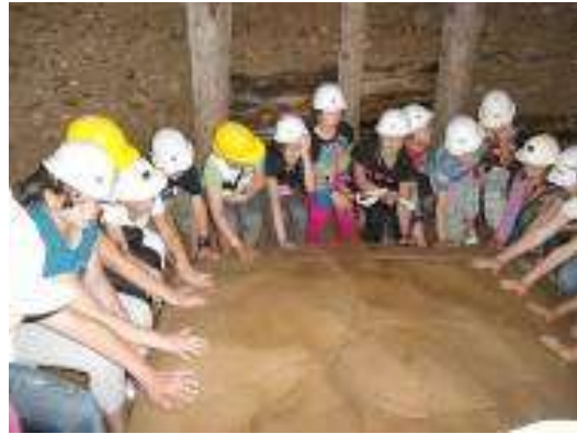
Meditation beim Keramik Block K-2