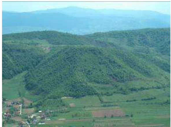
Luftaufnahme von der Bosnischen Mondpyramide