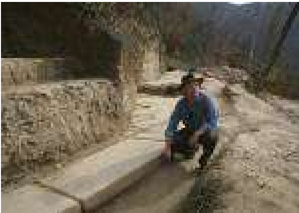
Gepflasterte Terrasse auf der Bosnischen Mondpyramide