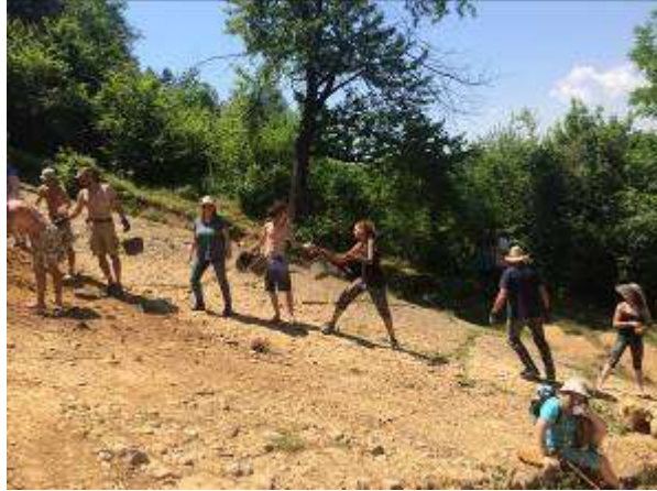
Bosnische Sonnenpyramide – Ausgrabungen