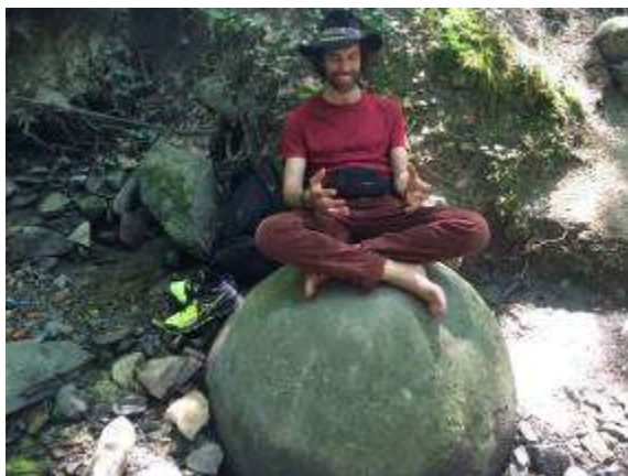
Bosnischer Stein-Kugel-Park in Zavidovici