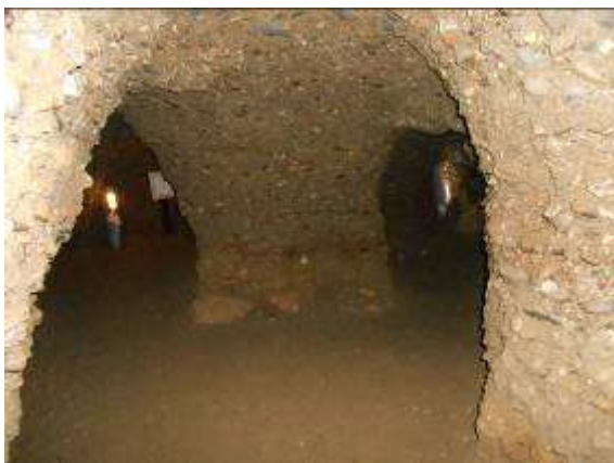
Unterirdisches Labyrinth Ravne