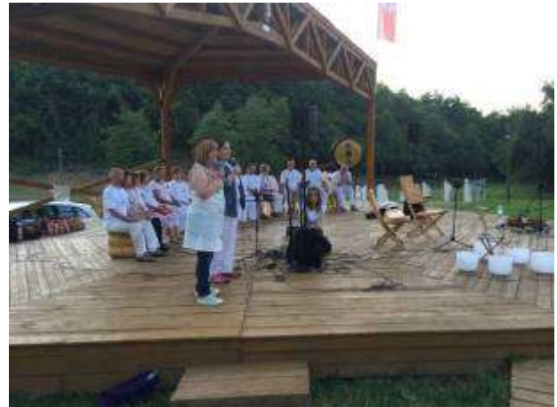
Festival zur Sommer-Sonnenwende 2017